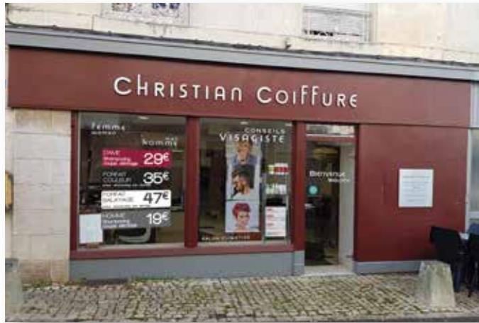
Christian coiffure à Melle (79)