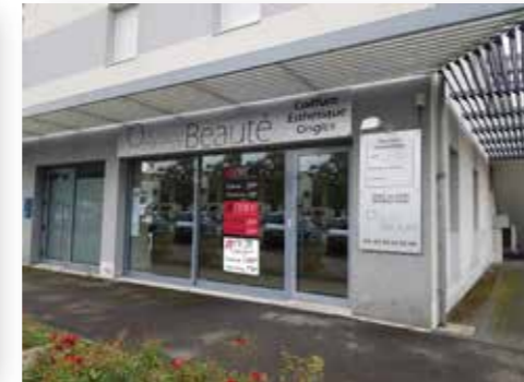
Cathy et L'Odysée de la Beauté à Sautron (44)